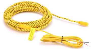
图 3 固定式感应线（出厂前已连接）